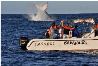
Sorties en mer

Un éco volontaire, garant du respect du code de bonne conduite à bord du bateau, assurera aussi bien l'animation que l'explication des différents comportements que vous observerez.