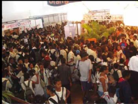
Les visiteurs de Ebit venus en masse pour découvrir les nouveautés Orange

Fidèle à sa valeur de proximité, Orange a tenu à se rapprocher davantage de ses clients en délocalisant Ebit à Tamatave, centre névralgique du haut débit à Madagascar.