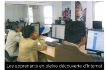
Les apprenants en pleine découverte d'Internet

Après une première phase de formation qui a débuté le 11 mai à Antananarivo, ces enseignants ont eu la possibilité de s'exercer en se servant d'une connexion gratuite pendant un mois. Pour évaluer le niveau requis, cette phase de familiarisation avec Internet sera suivie d'un jeu-concours dont le lauréat sera doté d'un ordinateur portable et d'une connexion Internet. Un blog d'enseignants sera également lancé au cours de la dernière phase du projet et servira d'outil de communication à l'ensemble des enseignants de l'Océan Indien. En effet, un volet du projet s'adresse également aux enseignants responsables de programmes parascolaires à Maurice.