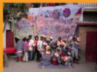
Lampions aux couleurs d'Orange pour les enfants de Graine de Bitume