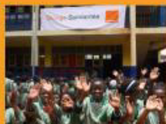
Le sourire des enfants de l'EPP Ivandry