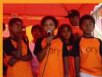
Un beau spectacle offert par les enfants d'Antsirabe