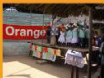
Institution Palmarès Mahajanga en fête